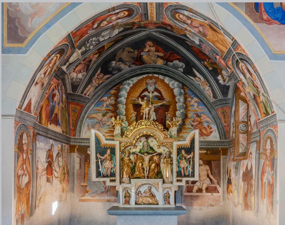
SS. Trinità Valfurva

terra, i pianeti, le stelle, le galassie; sia il micro-universo: le cellule, gli atomi, le particelle elementari. In tutto ciò che esiste è in un certo senso impresso il “nome” della Santissima Trinità, perché tutto l’essere, fino alle ultime particelle, è essere in relazione, e così traspare il Dio-relazione, traspare ultimamente l’Amore creatore. Tutto proviene dall’amore, tende all’amore, e si muove spinto dall’amore, naturalmente con gradi diversi di consapevolezza e di libertà. “O Signore, Signore nostro, / quanto è mirabile il tuo nome su tutta la terra!” (Sal 8,2) – esclama il salmista. Parlando del “nome” la Bibbia indica Dio stesso, la sua identità più vera; identità che risplende su tutto il creato, dove ogni essere, per il fatto stesso di esserci e per il “tessuto” di cui è fatto, fa riferimento ad un Principio trascendente, alla Vita eterna ed infinita che si dona, in una parola: all’Amore. “In lui – disse san Paolo nell’Areòpago di Atene – viviamo, ci muoviamo ed esistiamo” (At 17,28). La prova più forte che siamo fatti ad immagine della Trinità è questa: solo l’amore ci rende felici, perché viviamo in relazione per amare e viviamo per essere amati. Usando un’analogia suggerita dalla biologia, diremmo che l’essere umano porta nel proprio “genoma” la traccia profonda della Trinità, di Dio-Amore.