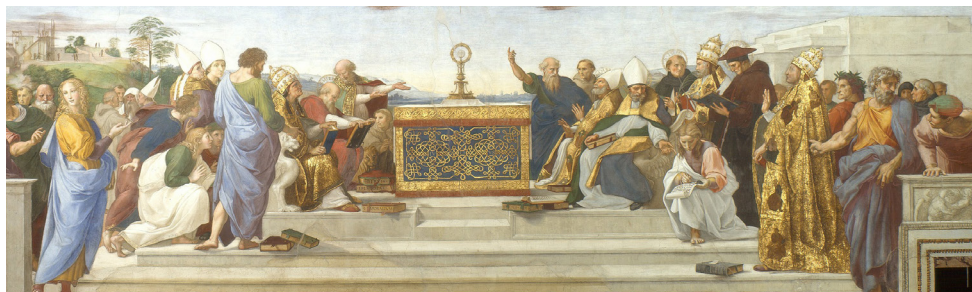
Raffaello, "Disputa del Sacramento", 1508-1511 (particolare) - Musei Vaticani