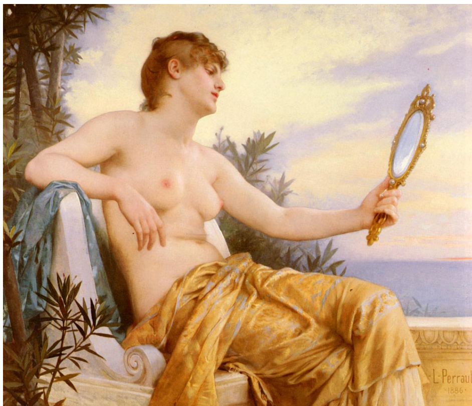
Vanitas, di Perrault Leon Jean Basile

Vi affido a Maria, la Vergine della speranza. Con il suo aiuto, tornando nei prossimi giorni ai vostri Paesi, in tutte le parti del mondo, continuate a camminare con gioia sulle orme del Salvatore, e contagiare chiunque incontrate col vostro entusiasmo e con la testimonianza della vostra fede! Buon cammino!