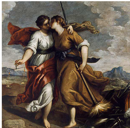
La giustizia a la pace si abbracciano - Jacopo Palma il Giovane

la fa da padrone, dove la pace è costruita su interessi economici, dove l'umanità perde di significato: il problema non è salvaguardare la Vita, ma guadagnarci! Non ti chiedo di porre fine alle guerre in virtù del valore che hanno tante vite, ma grazie a territori, ricchezze che sono disposto a cederti... Può essere questo il nostro modo di vivere e relazionarci?