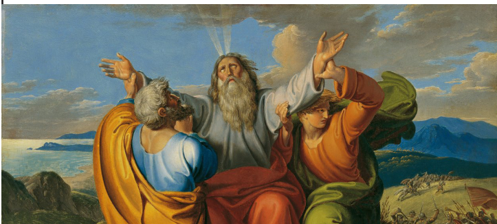
Mosè in preghiera con Aronne e Cur sul monte Oreb - Joseph von Fuhrich -