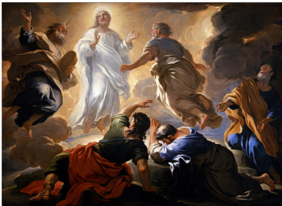
Trasfigurazione di Cristo - Luca Giordano

della Pasqua di Gesù, che è mistero di passione, morte e risurrezione, e l'identità della Chiesa. Nel contempo esso ci rende grati di appartenere alla Chiesa, corpo di Cristo risorto e unico popolo di Dio pellegrinante nella storia, che vive come presenza santificatrice in mezzo a un'umanità ancora frantumata, quale segno efficace di unità e riconciliazione tra i popoli.